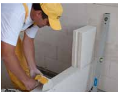
Zaprawę rozprowadzamy kielnią do cienkich spoin