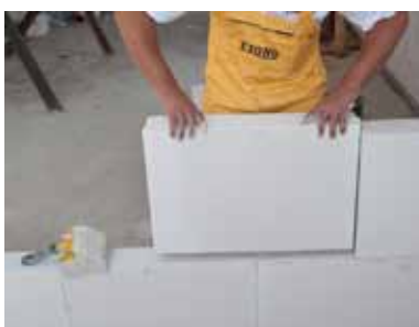
Murujemy kolejną warstwę pamiętając o przesunięciu spoin pionowych