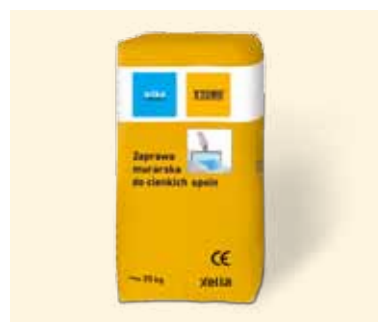
Zaprawa systemowa SILKA-YTONG