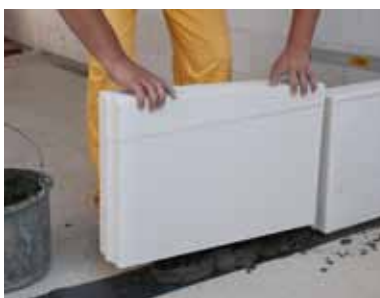
Dostawiamy kolejny bloczek, bez wypełniania spoin pionowych – zastępuje je system pióro-wpust