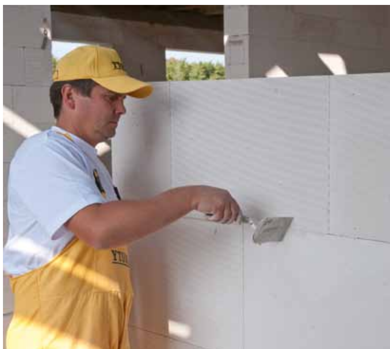
Bloczki YTONG INTERIO to równa i gładka ściana