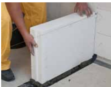
Pierwszą warstwę bloczków układamy na tradycyjnej zaprawie, pamiętając o izolacji przeciwwilgociowej