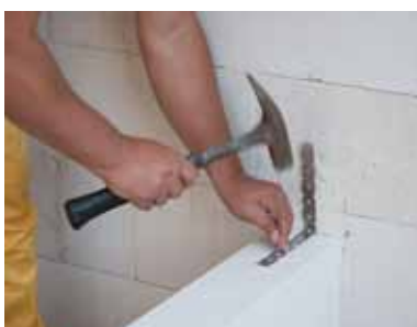
Ścianę działową łączymy ze ścianą nośną za pomocą metalowych łączników